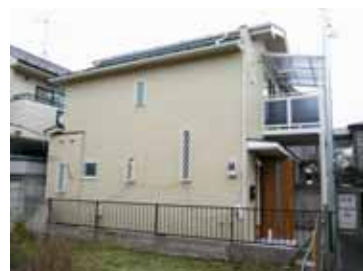
リフォーム後の外観