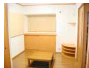
こだわりのリビング 掘り炬燵の周囲は床暖房、 作り付けのテレビ台