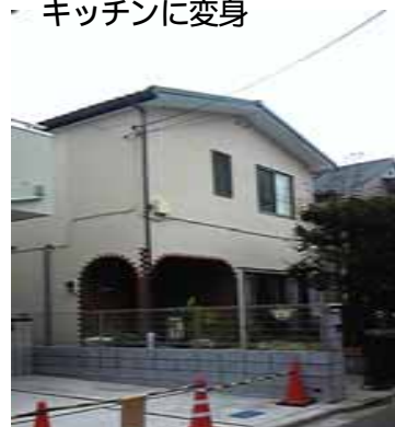
リフォーム後の外観 すっかり変わりました。