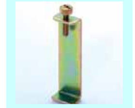
コの字転倒防止金具 上下の家具を固定します