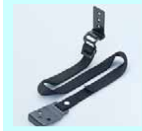
たんすガード たんすを柱などに固定