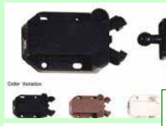
クワガタラッチ 扉を閉めると、自動的にラッチがかり、内側から押されても、勝手に扉が開くことはありません。