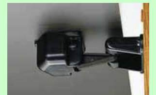
耐震ロック 普段は、普通に扉を開け閉めできますが、地震によって家具が揺さぶられたり、前方に傾くと、瞬時にロック機能が働きます。おおむね震度5以上で動作します。